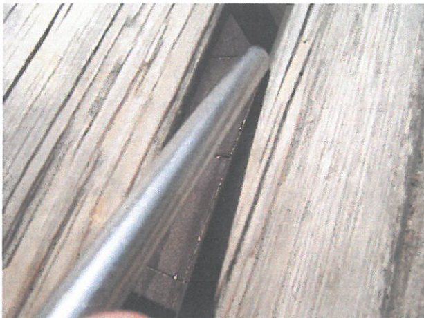
7.) hatszögletű mászóka