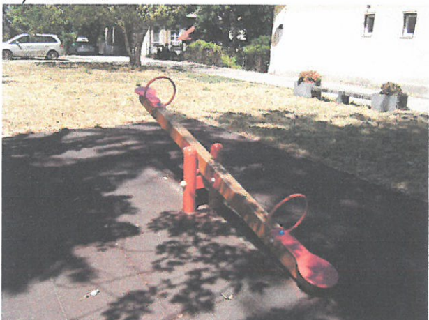
3.) napocska rugós játék